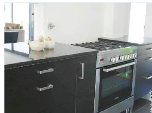
grande cuisine américaine