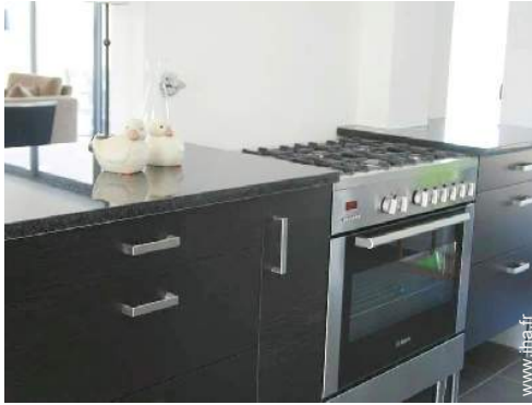
grande cuisine américaine