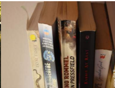
collection de livres