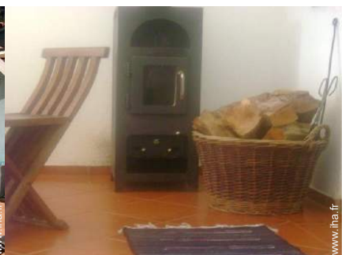
poêle à bois