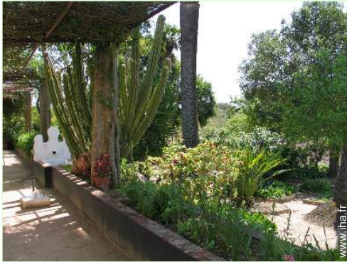
Cadre extérieur à disposition des hôtes