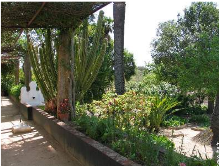
Cadre extérieur à disposition des hôtes