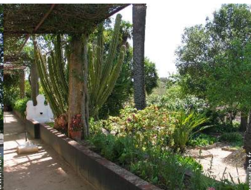
Cadre extérieur à disposition des hôtes