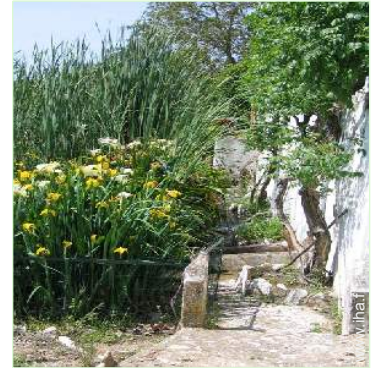
Cadre extérieur à disposition des hôtes