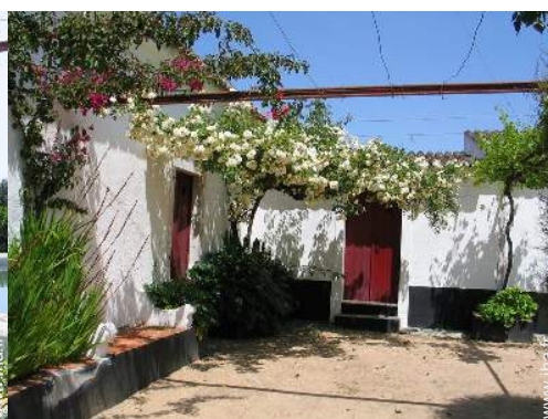
Cadre extérieur à disposition des hôtes