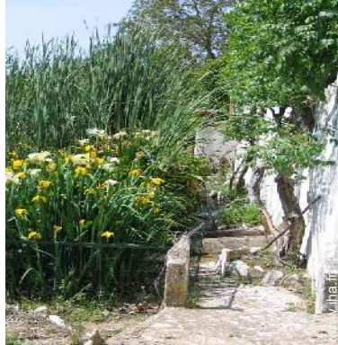
Cadre extérieur à disposition des hôtes