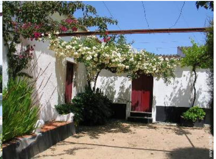
Cadre extérieur à disposition des hôtes