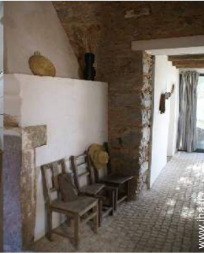
Ancienne Ferme de Charme