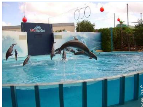
Attraites et détente