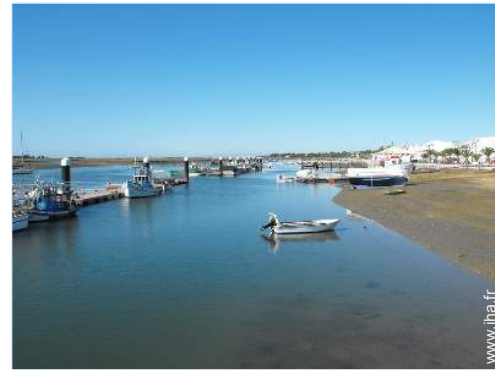
vue sur océan

Barbecue, transat(s), balançoire, portique enfant