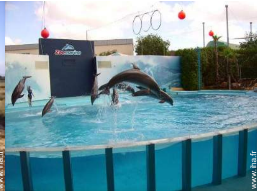
Attraites et détente