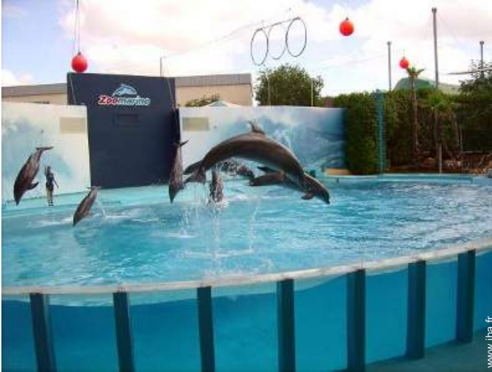
Attraites et détente