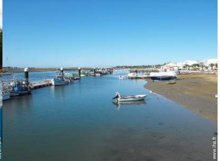
vue sur océan