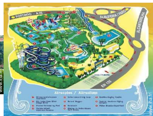
parc de loisirs