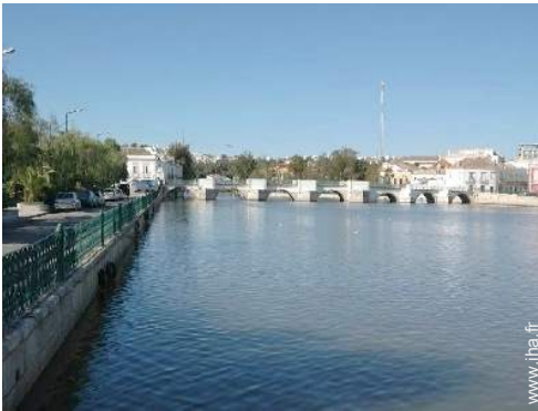
vue sur centre ville