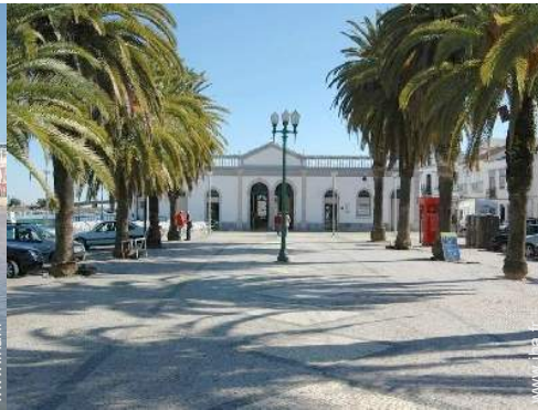
vue sur centre ville