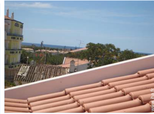
vue depuis la terrasse sur toit