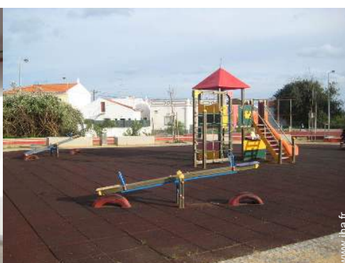
parc de loisirs