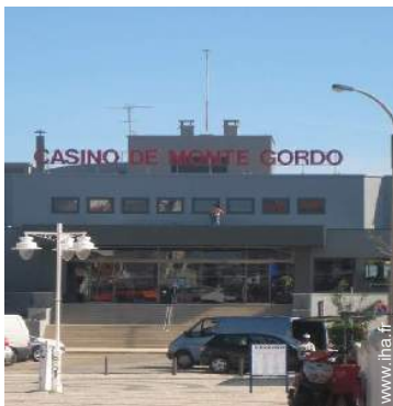
Villes à proximité