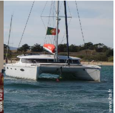
loisirs d'été à proximité