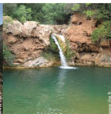
Villes à proximité