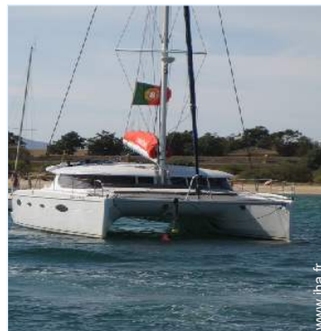
loisirs d'été à proximité