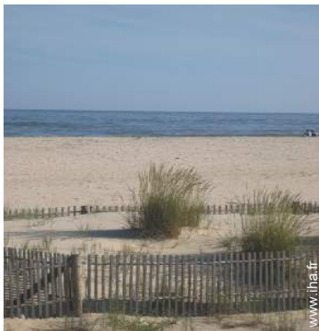
loisirs d'été à proximité