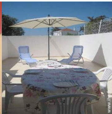
Equipements à disposition