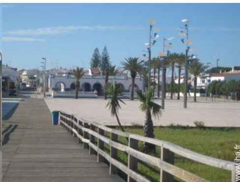
chemin de promenade