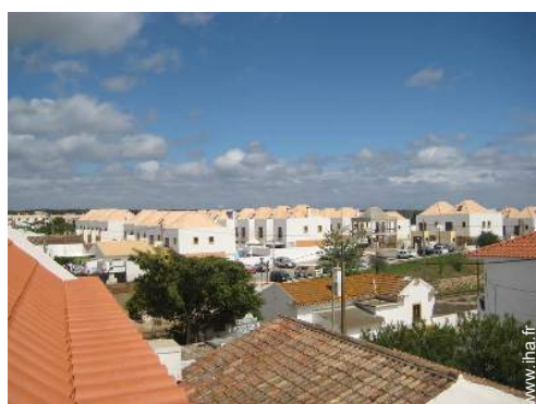
vue depuis la terrasse sur toit