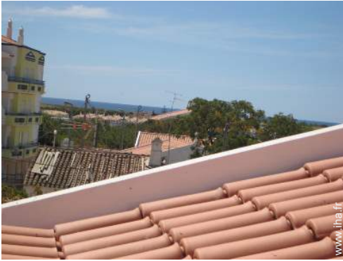
vue depuis la terrasse sur toit