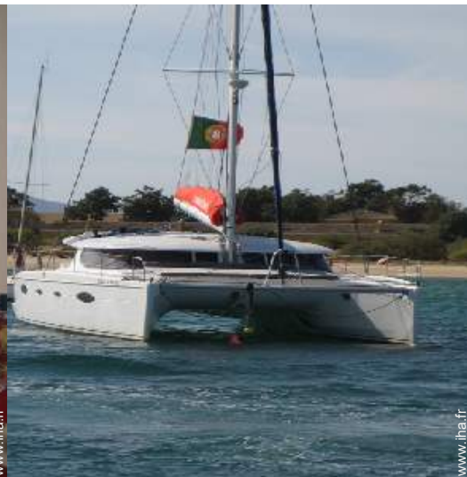
loisirs d'été à proximité