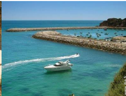
port de plaisance