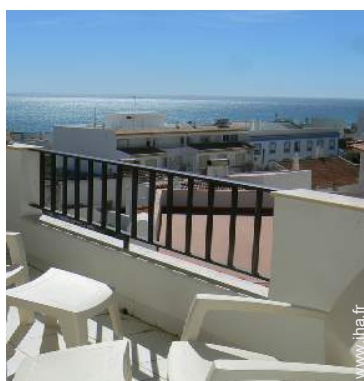
vue sur océan