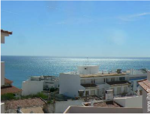
vue sur les toits