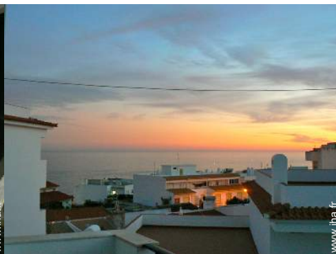
vue sur les toits