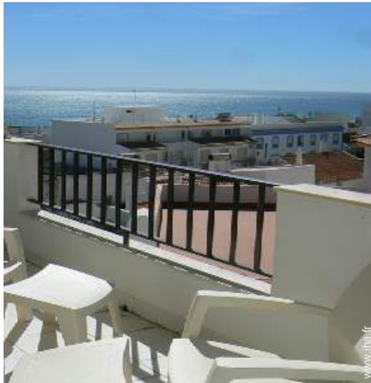
vue sur océan