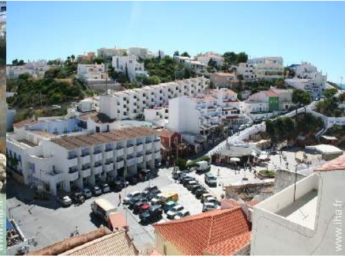
vue depuis la terrasse sur toit