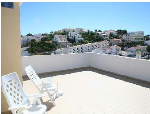
terrasse sur toit