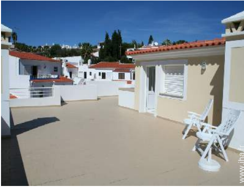
vue sur les toits