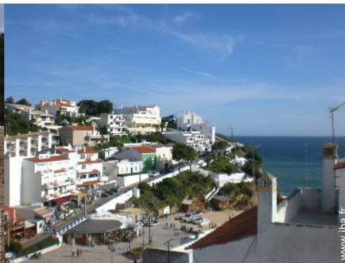
vue sur la place