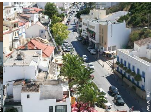
vue sur les toits