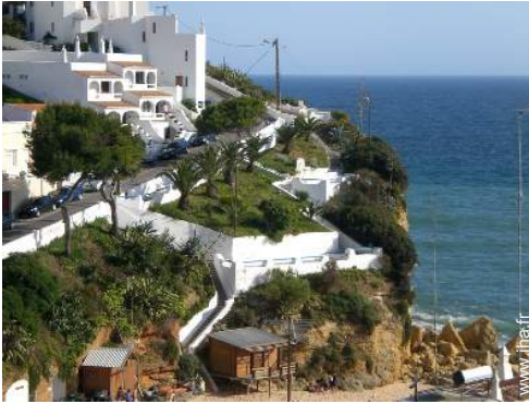
vue depuis la terrasse sur toit