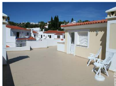
vue sur les toits