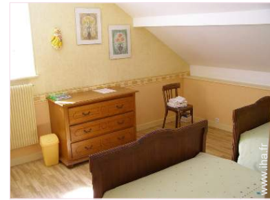
La chambre d'hôte

Wifi (accès internet sans fil), armoire, penderie, chauffage central, fenêtre de toit