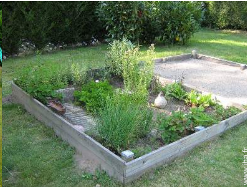
bac à sable