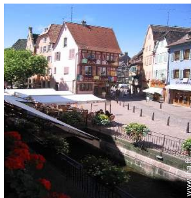
vue sur rue piétonne