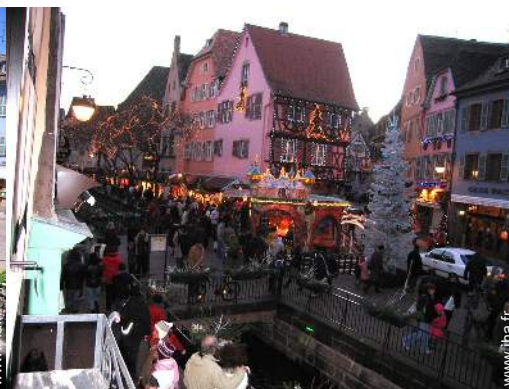
vue sur la place