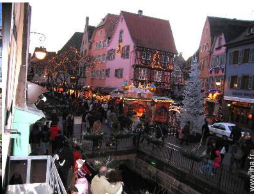
vue sur la place