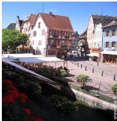
vue sur rue piétonne