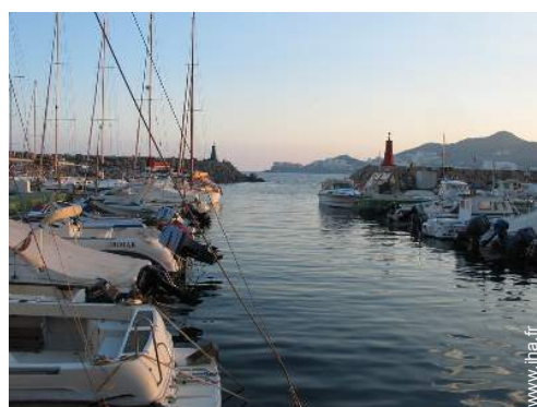
excursion en bateau