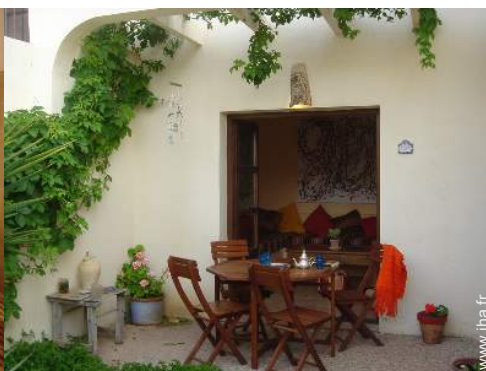
abri de jardin