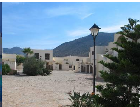
Résidence de standing