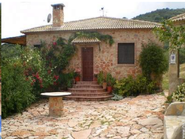
Maison en Pierre