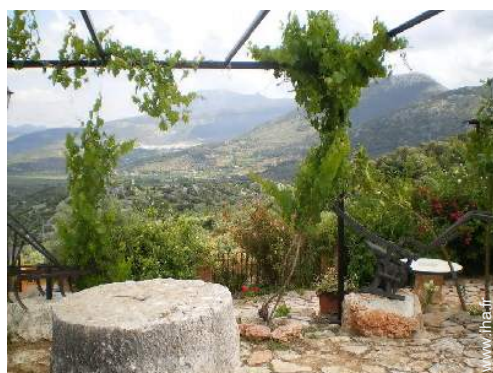
vue sur champs agricoles