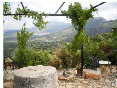
vue sur champs agricoles