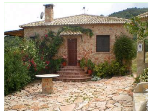
Maison en Pierre