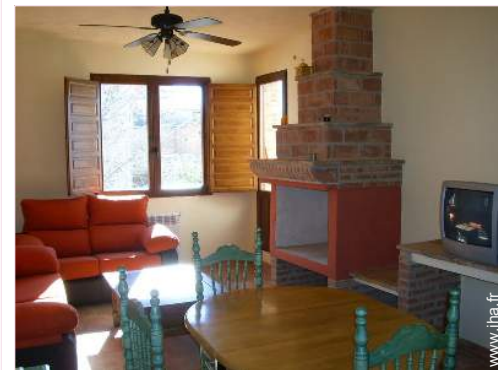
Maison de Charme