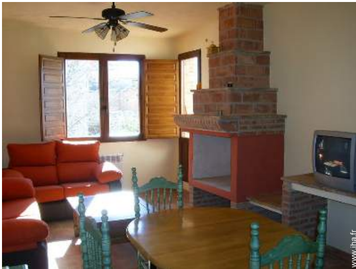
Maison de Charme