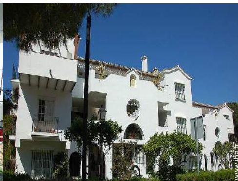
Demeure de Charme