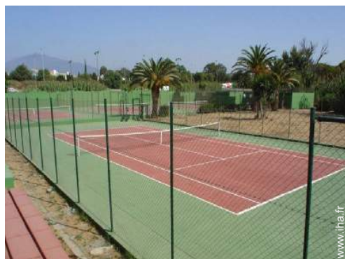
Tennis - surface dure