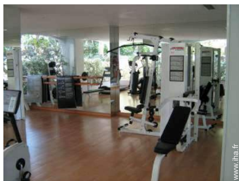
machine(s) de musculation