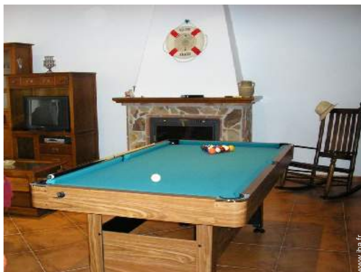
table de billard