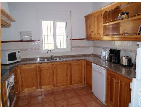
grande cuisine américaine