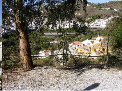
vue sur village