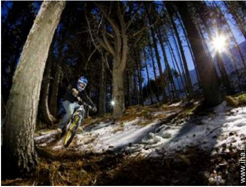
VTT (itinéraire circuit)