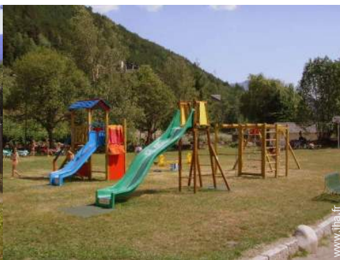
bac à sable