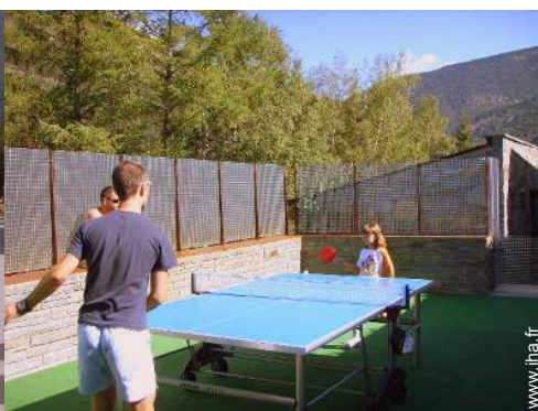
table de ping-pong