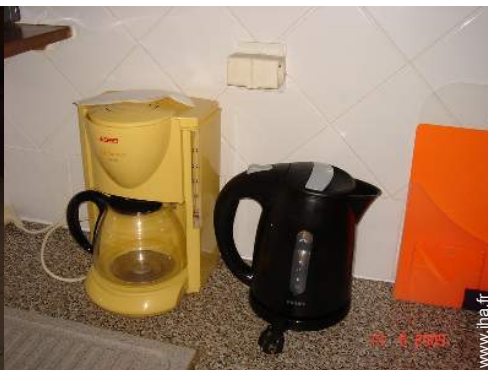
machine à café électrique