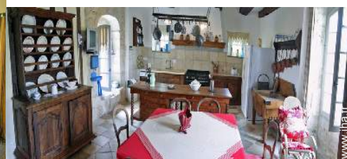
grande cuisine indépendante