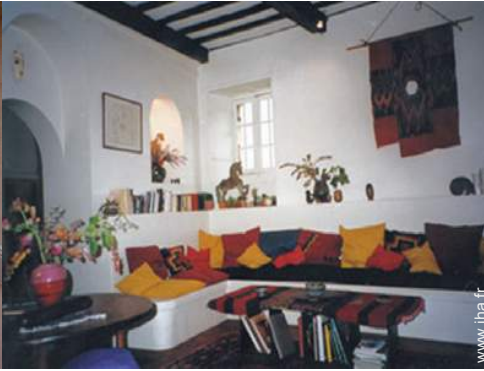
salon de musique