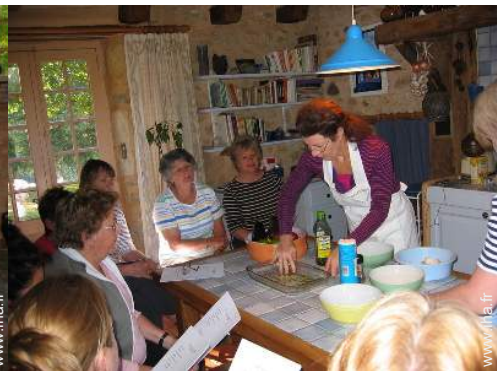
grande cuisine indépendante