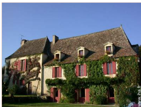
Bastide de Charme