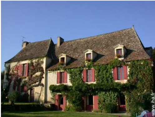
Bastide de Charme