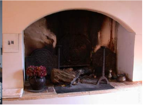
salon de musique