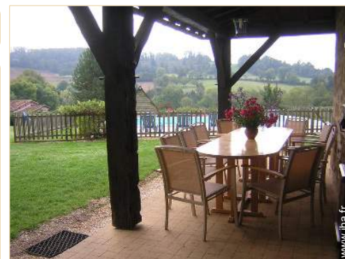
salon de jardin