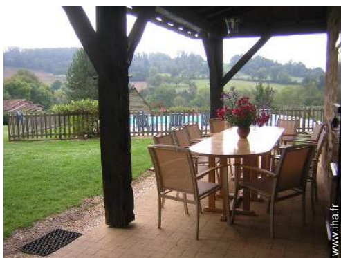
salon de jardin