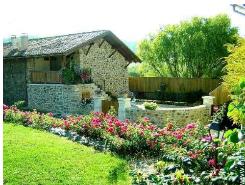
Maison de Charme