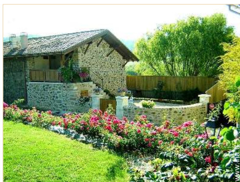
Maison de Charme