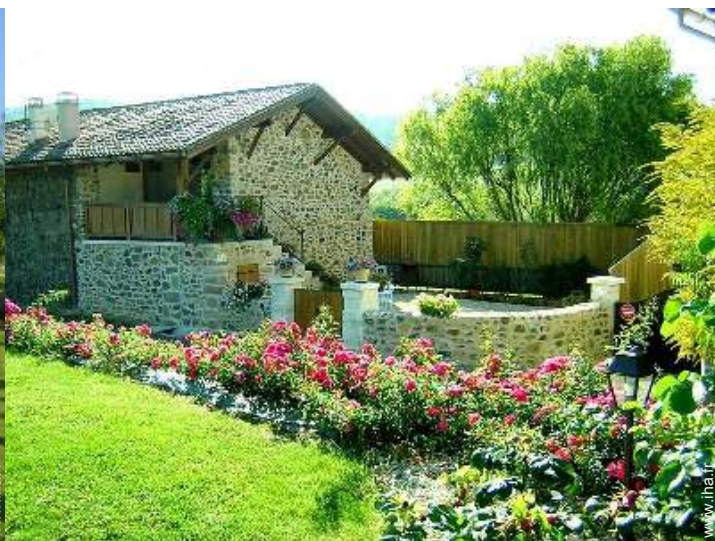
Maison de Charme