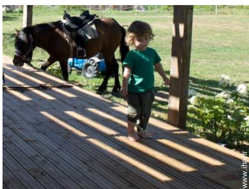
matériel équestre et chevaux