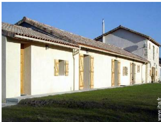
Ancienne Grange de Charme