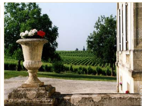
vue sur vignobles

Salon d'été, barbecue, table(s) de jardin, chaise(s) de jardin, parasol, salon de jardin, 6 transat(s), balançoire, portique enfant, douche extérieure