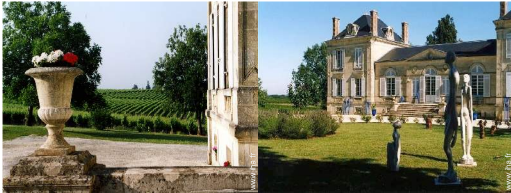
vue sur vignobles