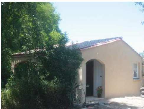
Maison de Charme