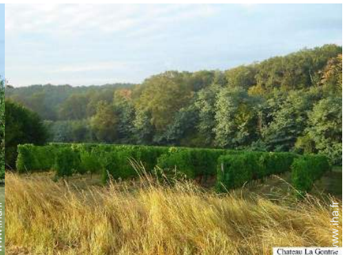
vue sur vignobles