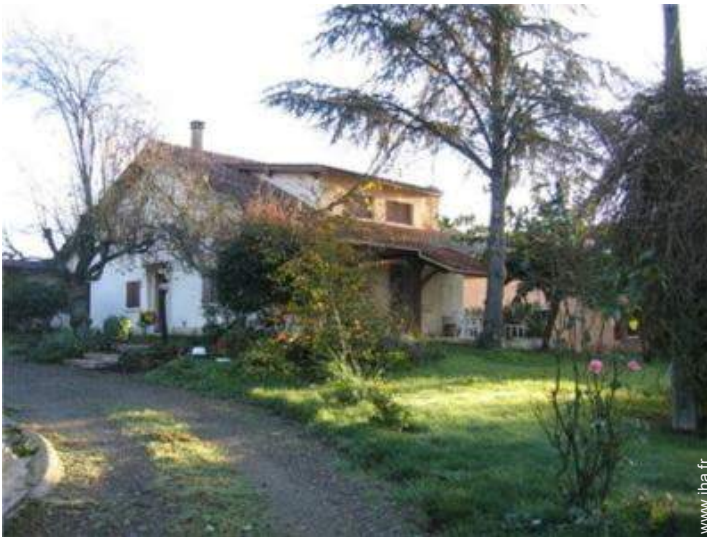
Maison de Campagne