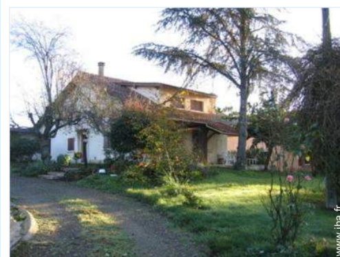
Maison de Campagne