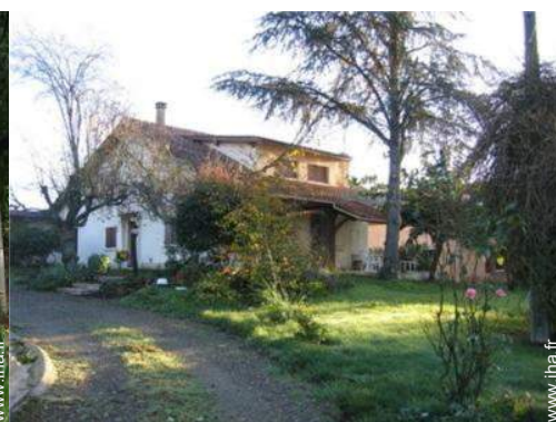
Maison de Campagne