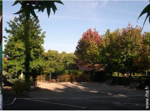
terrain de pétanque