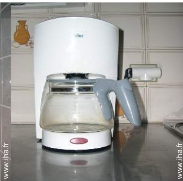
machine à café électrique