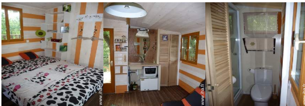
canapé-lit(s) 2 pers