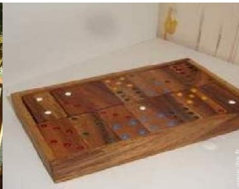
jeux de société