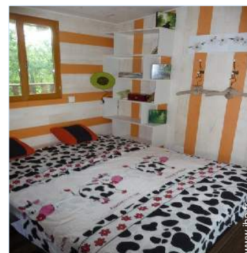
canapé-lit(s) 2 pers