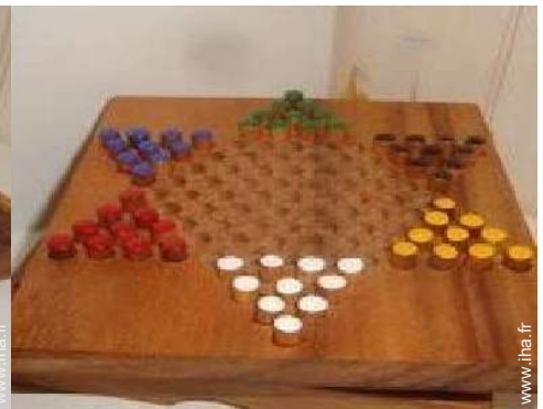
jeux de société