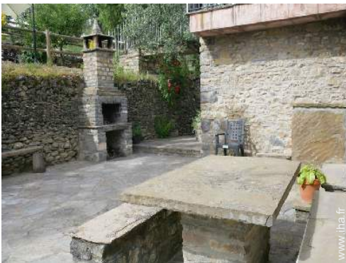
table(s) de jardin