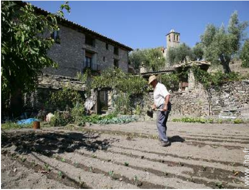
Maison de Village