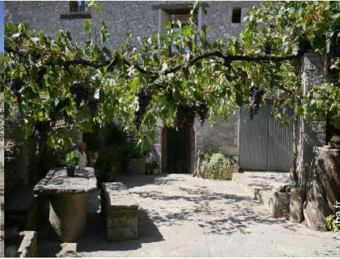
Maison de Village