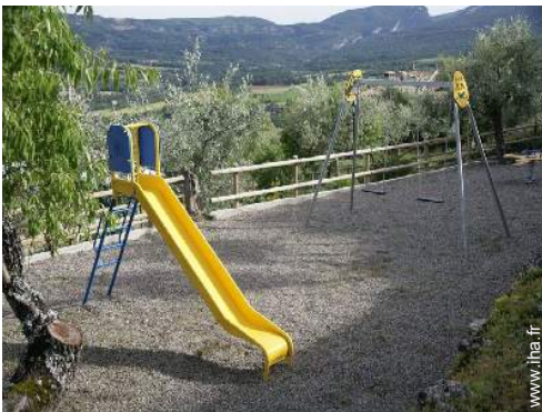
bac à sable