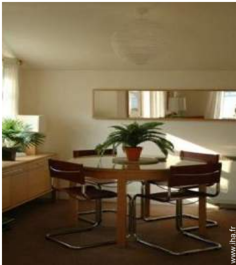
Cottage de Charme