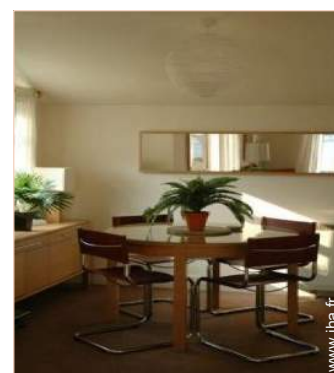
Cottage de Charme