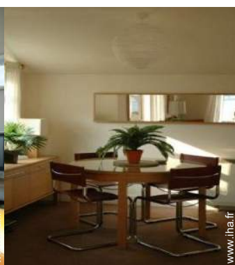
Cottage de Charme