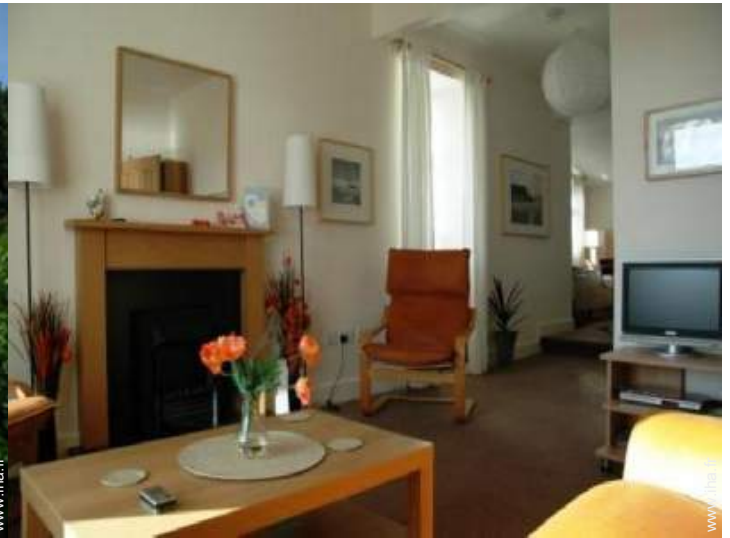
Cottage de Charme