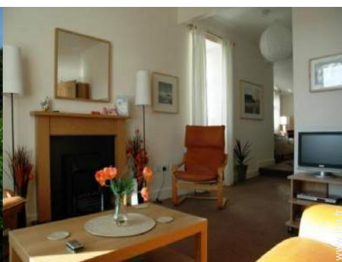
Cottage de Charme