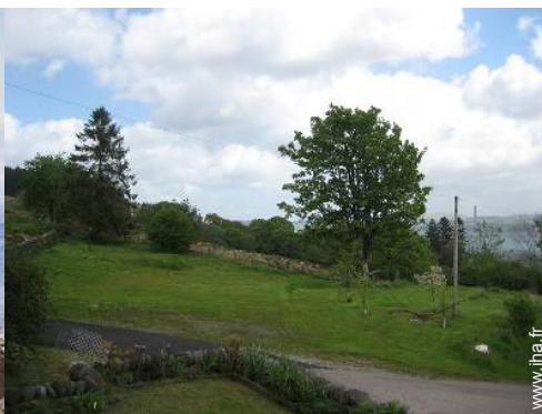
vue sur champs agricoles