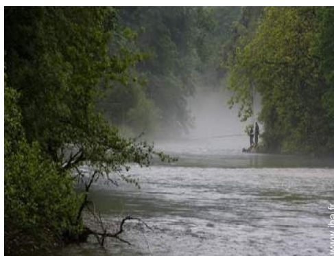
pêche à la ligne