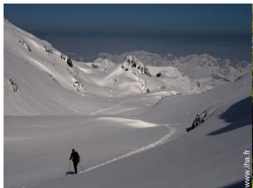
ski de randonnée