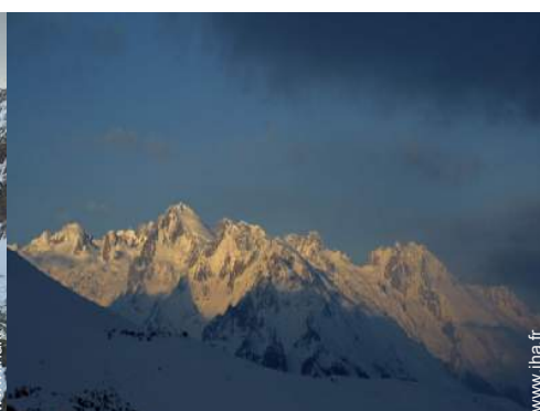
loisirs d'hiver à proximité