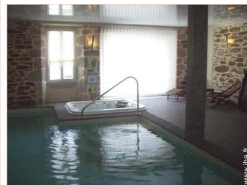
Attraits et détente