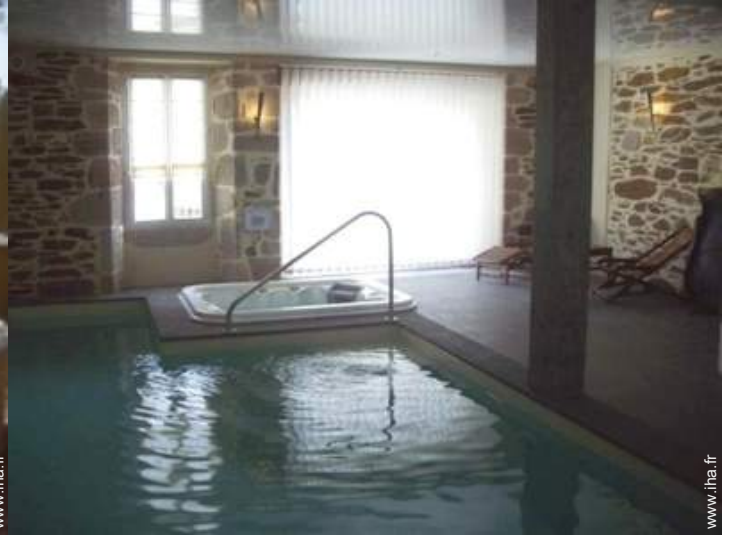
Attraits et détente