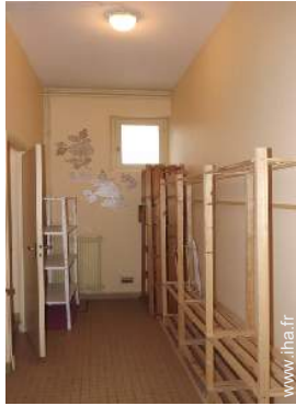
local à ski