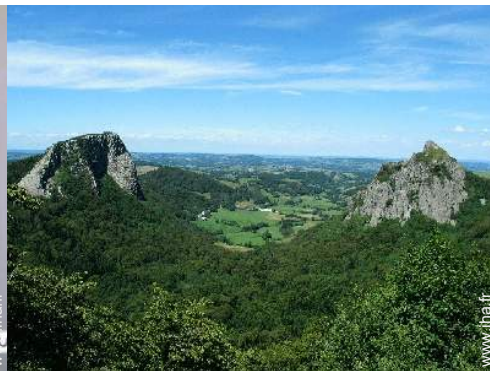
loisirs de montagne à proximité