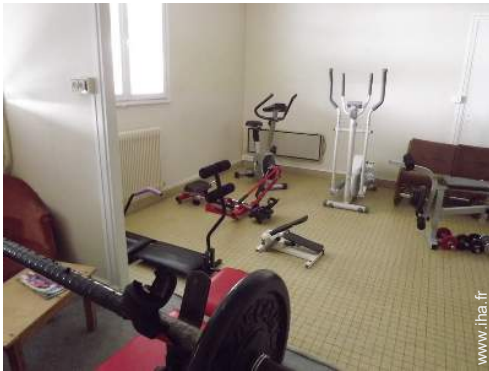
Confort intérieur et équipements