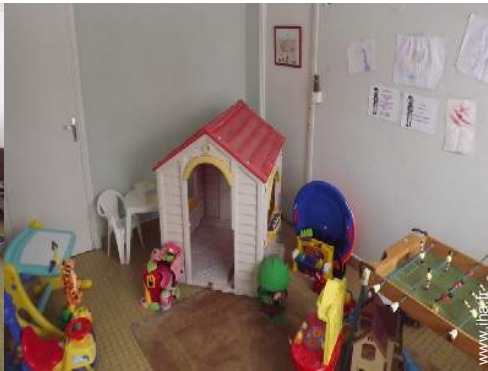
salle de jeux