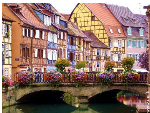
Villes à proximité