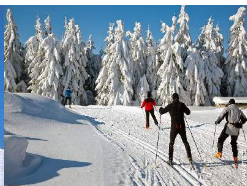
ski de fond