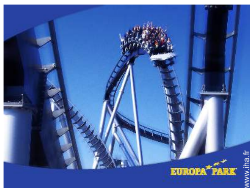
parc de loisirs