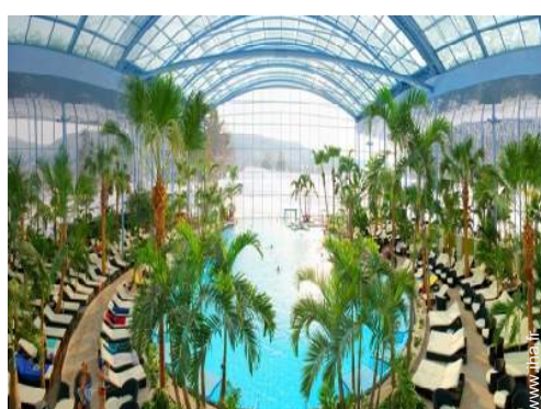
loisirs balnéaires à proximité