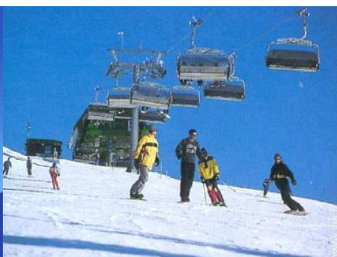
pistes de ski