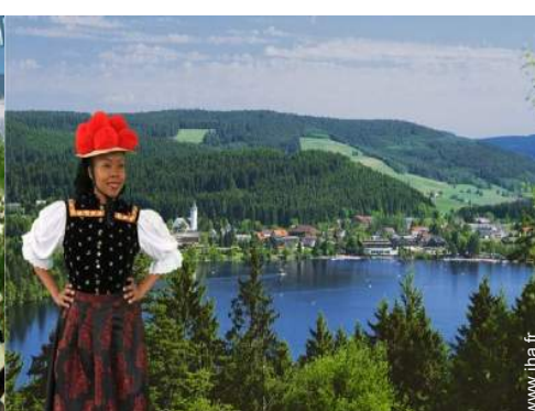
Villes à proximité