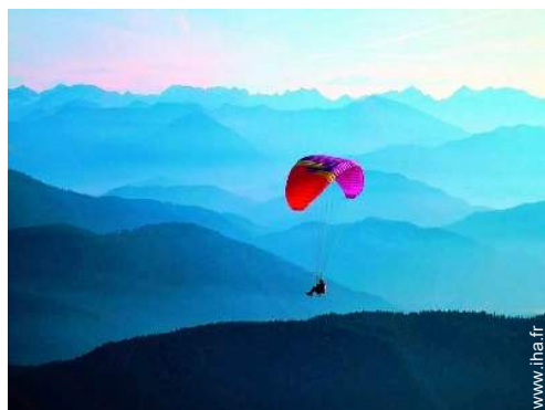
loisirs aériens à proximité