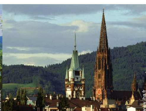
Villes à proximité