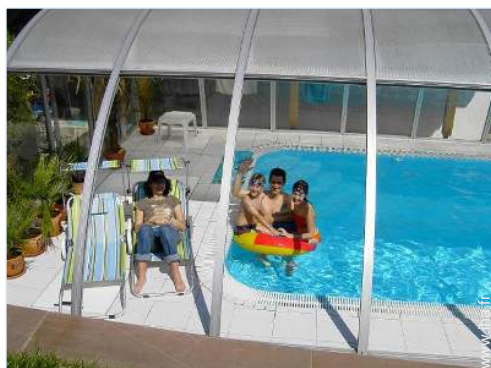
Piscine d'eau de mer