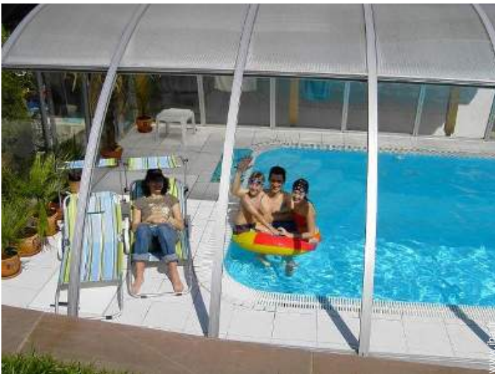
Piscine d'eau de mer