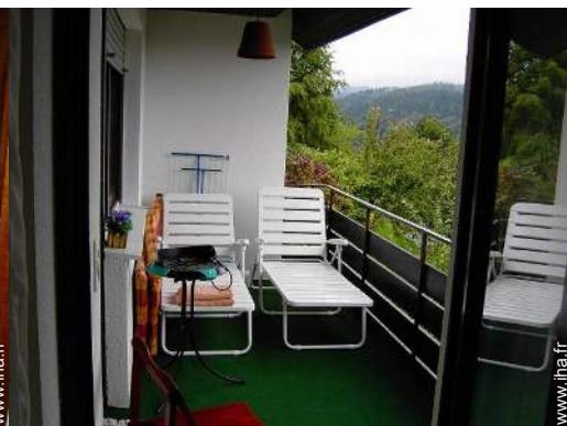
vue depuis la loggia