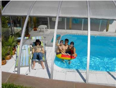
Piscine d'eau de mer