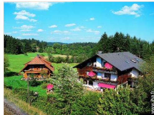
Propriété de Charme

- Centre ville 3km - Arrêt/station de bus 300m - Super marché 2,5km