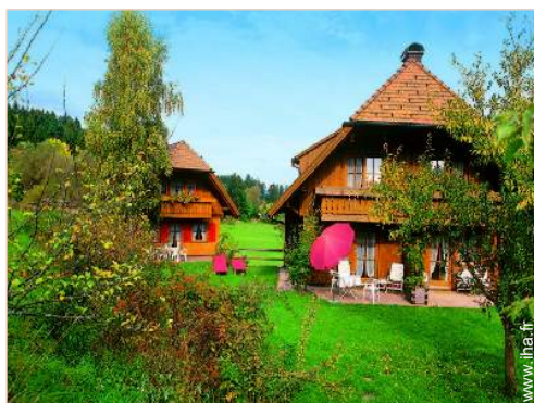
Propriété de Charme