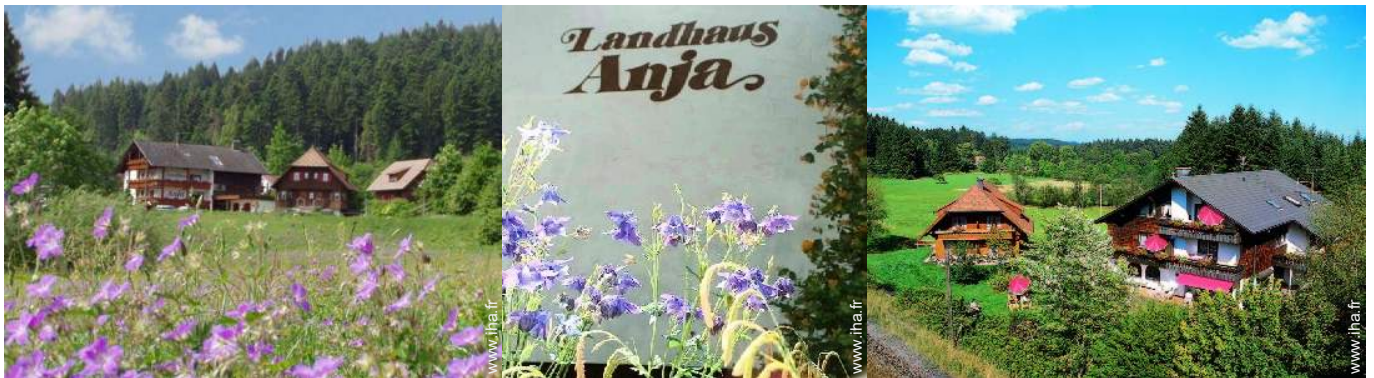
Propriété de Charme