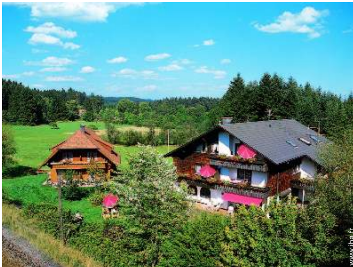
Propriété de Charme