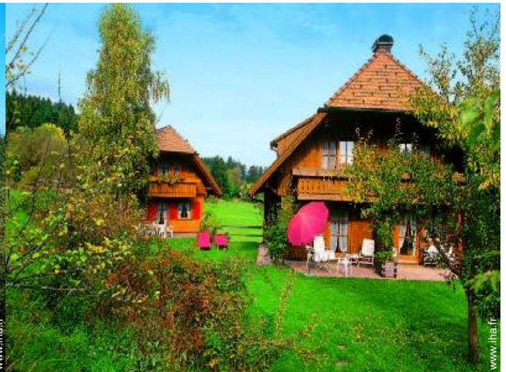
Propriété de Charme