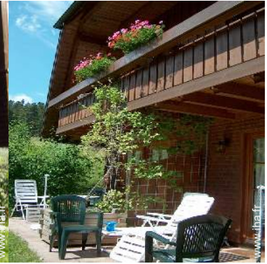
Propriété de Charme