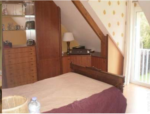
chambre du propriétaire