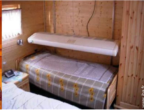
cabine de bronzage