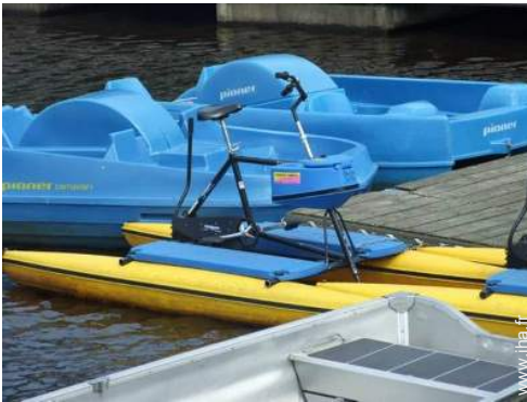
loisirs nautiques à proximité