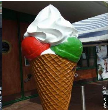
loisirs d'été à proximité