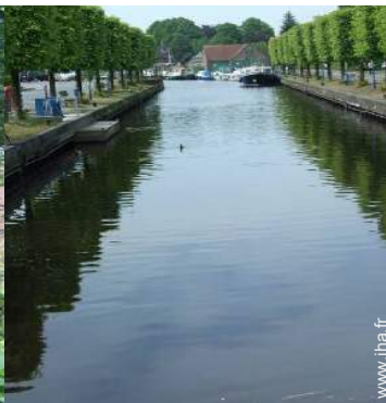
loisirs d'été à proximité