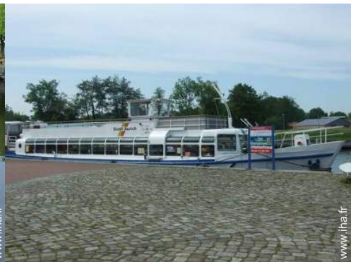
loisirs d'été à proximité