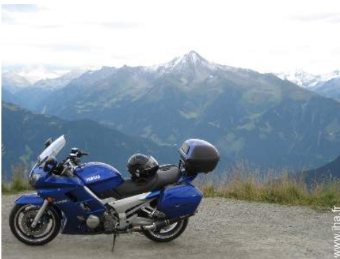
loisirs mécaniques à proximité