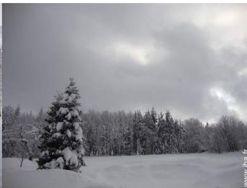
vue sur forêt