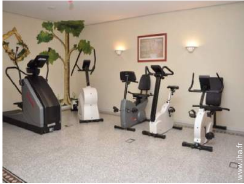
machine(s) de musculation