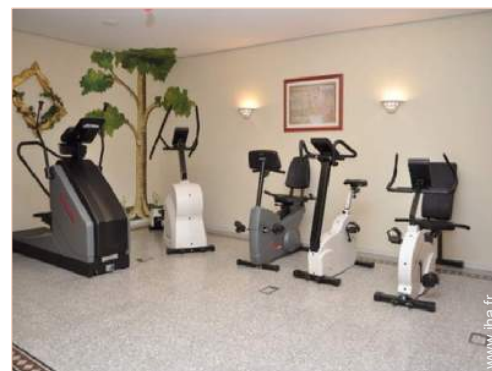
machine(s) de musculation