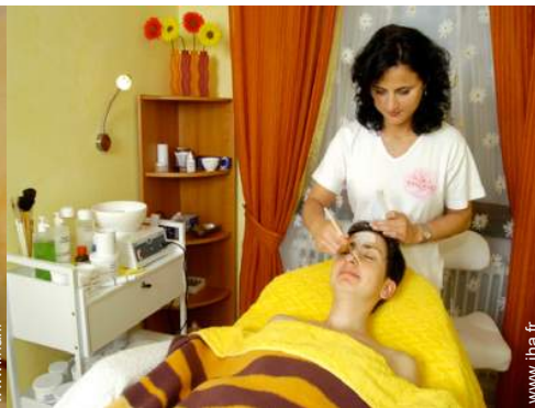
soin de beauté