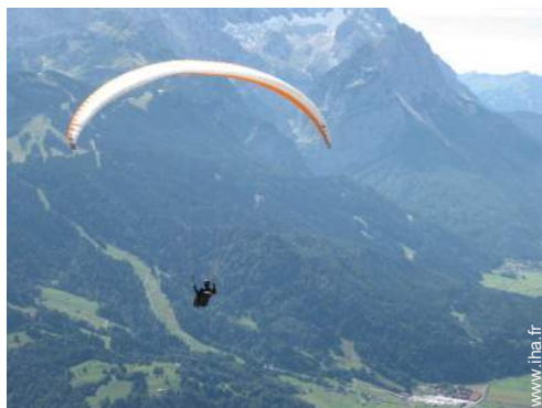
loisirs aériens à proximité