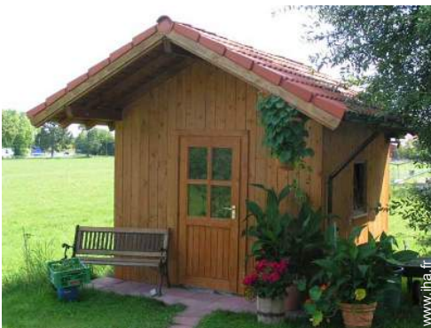
abri de jardin