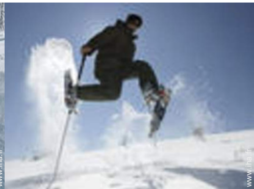
ski de randonnée