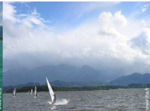
planche à voile