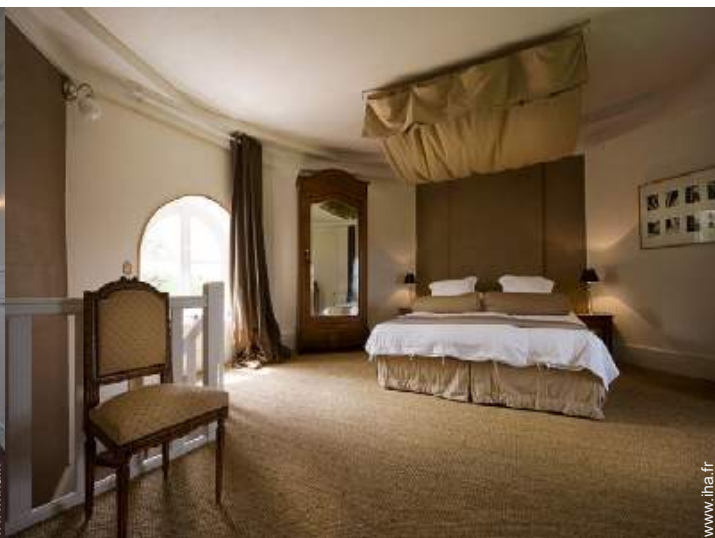
lit(s) double(s) à baldaquin